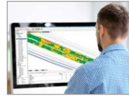
Bauleitung | Büro