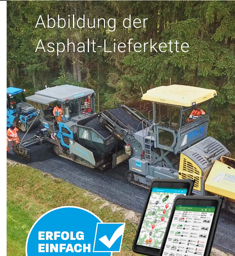
Abbildung der Asphalt-Lieferkette